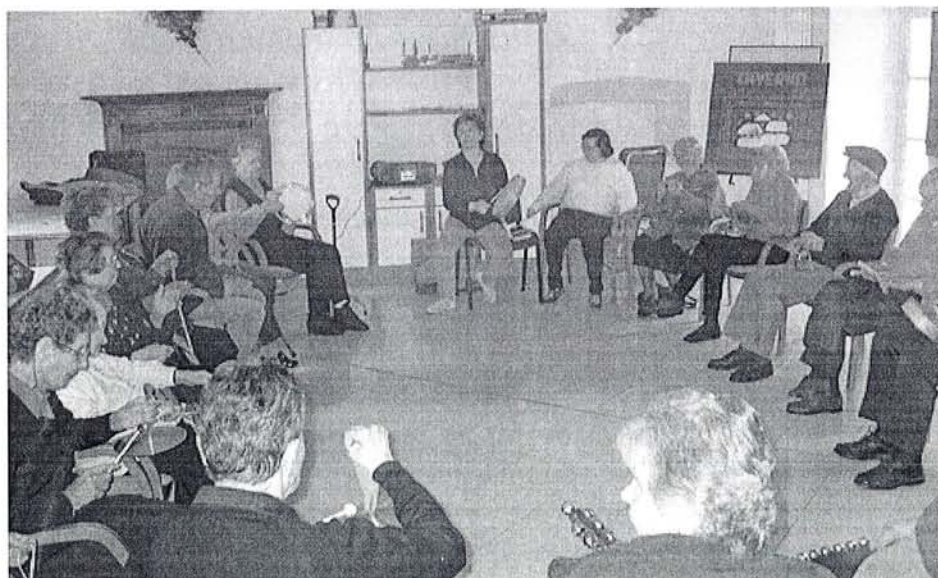
Gli Ospiti del Centro Diurno

Come potete vedere, ci diamo da fare, la musicoterapia è una attività complessa e sicuramente ci aspettano ancora delle belle sorprese. Non ci resta allora che ritornare al nostro lavoro, salutarvi con un arrivederci alla prossima uscita del giornalino